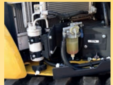
Filtrul de combustibil mare si prefiltrul combustibil cu separator de apa protejeaza motorul