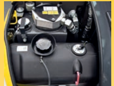
Acces usor sub capota frontala, reducerea combustibilului si a uleiului