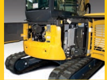
Capace de vizitare in partea din spate pentru verificari rapide ale motorului, inspectii si curatari ale radiatoarelor foarte simple si acces usor la baterie

Conectorii hidraulici de etansare si conectorii electrici DT cu sistem hidraulic ORFS sporesc fiabilitatea utilajului si fac repararea mai usor de realizat, intr-un timp mai scurt. Folosirea unor bucese de rezistenta ridicata si un interval de schimbare a uleiului de motor de 500 de ore reduc in continuare costurile de operare.