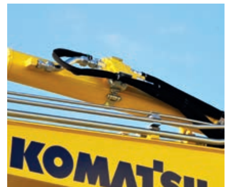
Supape de suprapresiune pe cilindrii brat si balansier