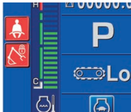
Atentie la centura de siguranta si la sistemul de detectare a pozitiei neutre